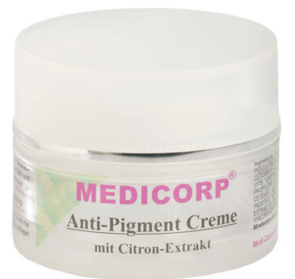
Art. Nr. 942 50 ml

Kaviar-Creme mit echtem Kaviar-Extrakt, hochwirksamen Q10 und wertvollem Vitamin E