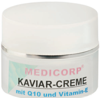
Art. Nr. 941 50 ml