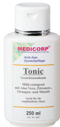
Art. Nr. 865 250 ml