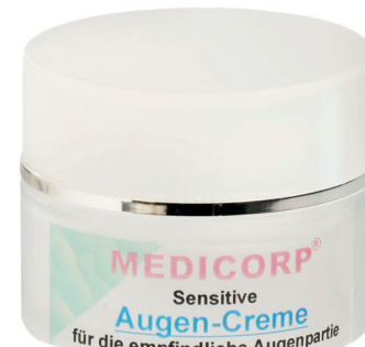
Art. Nr. 956 50 ml

Reichhaltig und pflegend, besonders auch als Nachtcreme geeignet