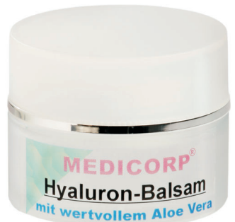
Art. Nr. 944 50 ml

Ein spezielles Gel gegen rote Äderchen im Gesicht. Diese Äderchen werden gemildert oder leichte verschwinden oft ganz