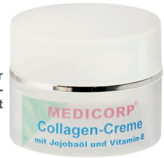
Art. Nr. 943 50 ml

Anti-Pigment-Creme mit Citron-Extrakt, Hyaluron und den Vitaminen A und E