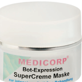
Art. Nr. 864-8 50 ml

Die optimale Ergänzung zum Supergel und der Supercreme mit dem natürlichen Wirkstoff aus der tropischen Pflanze ACMELLA OLERACEA entspannt die Muskulatur und mindert selbst tiefere Falten. Für weichere und harmonischere Gesichtszüge und weniger tief ausgeprägte Mimikfalten. Möglichst in Kombination mit ANTI-AGE-SUPERGEL/-CREME verwenden. Mit Aloe Vera, Vitamin E, Kaolin u. Sojaöl. Für lang anhaltende Feuchtigkeit.