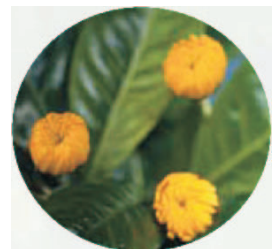
Abb. links: Die Insel "La Réunion" im indischen Ozean, wo der Wirkstoff für das MEDICORP Anti-Age-System aus der tropischen Pflanze ACMELLA OLERACEA (Abb. rechts) gewonnen wird. Bekannt auch als sogenanntes Indianerkraut: Das Kauen der Pflanze bewirkt z. B. eine Abnahme von Zahnschmerzen (taubes Gefühl im Mundbereich).