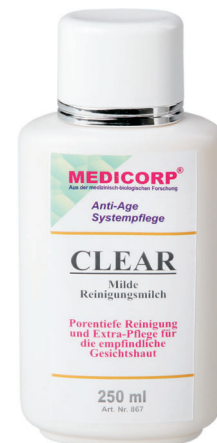
Art. Nr. 867 250 ml

Die Haut wird porentief gereinigt und auf die Tages- oder Nachtpflege vorbereitet.